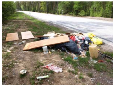
kan se ut så här efter skräpdumpning ...