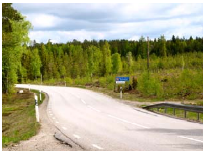
En ren och fin landsväg

En annan intressant teori som vi försöker följa upp är att de ökade kraven på sopsortering och återvinning ökar dumpningen av skräp.