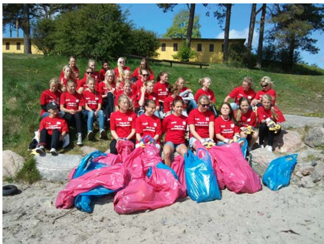
Tjejerna från Onsala BK njuter i solen efter en väl genomförd insats för strandmiljön.

De röda nålarna på kartan illustrerar genomförd strandstädning. De gröna nålarna visar det som föreningarna kommer att städa under resten av sommaren.