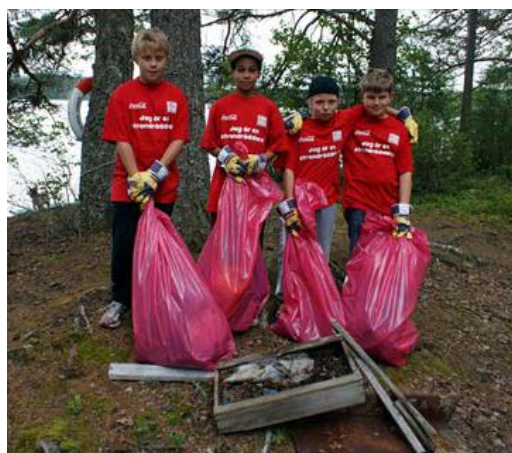
Några killar från Mockfjärds BK som var med i strandstädningen i Mockfjärd.

I år städar föreningarna utöver evenemangen även vid insjöar, såsom runt Vänern, Vättern och Siljan. Mockfjärds BK är en av föreningarna som städade just kring insjöar i Dalarna och är väldigt nöjda med insatsen.