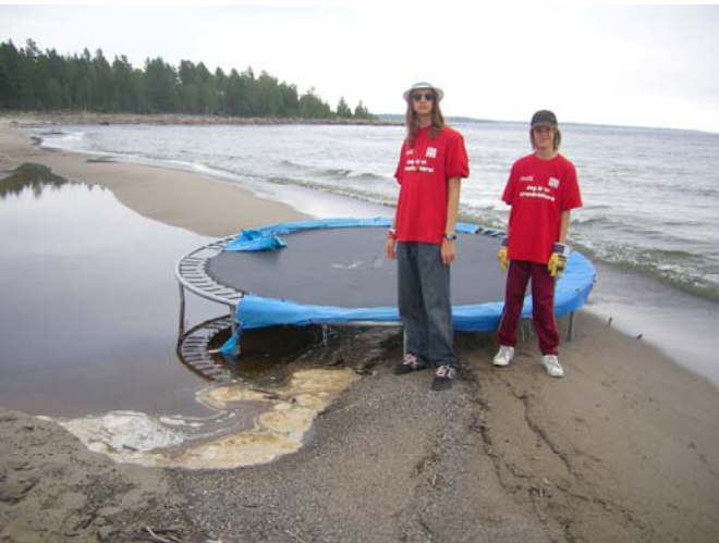
Studs mattan hittades av Salusands Surfers i Ångermanland

I slutet av september avslutades årets strandstädning när Ösmo Scoutkår städade Torö stenstrand i Nynäshamns Kommun. Och lokalbefolkningen som såg den för dagen rödklädda scoutpatrollen reagerade positivt som många andra gjort under sommaren.