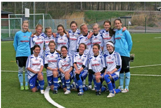
Onsala BK F-95

Att det skall vara roligt att spela fotboll och att man är stolt över att representera OBK