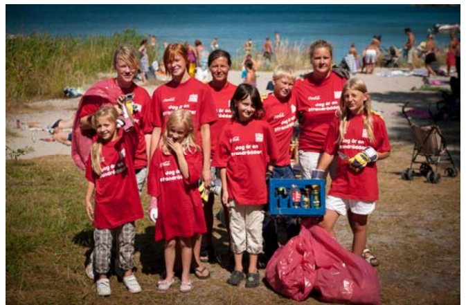
Strandräddare på Uto

Strandräddningen rapporteras i sin helhet i nästa Nyhetsbrev.